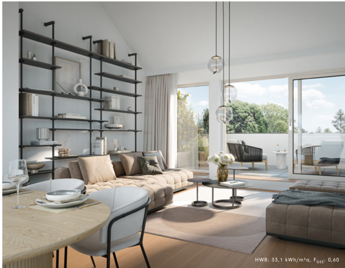
HWB: 33,1 kWh/m 2 a, F GEE : 0,60

Ich liebe es, in meinen Kräutergarten zu gehen, die frischen Kräuter zu riechen und zu ernten. Lavendel, Kamille und Melisse sind heilsam für Körper und Seele und helfen mir, nach einem anstrengenden Tag zu entspannen – bei einer Tasse Melissentee oder einem heißen Lavendelbad. Kräuterkissen mit getrockneten Kamillenblüten lassen mich tief und beruhigt schlafen.